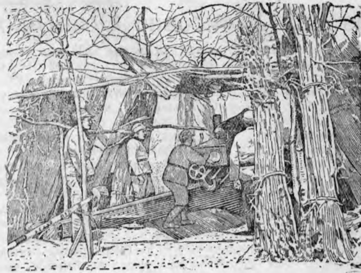
На рисунке: Бойцы китайской армии обстреливают противника (Центральный фронт).